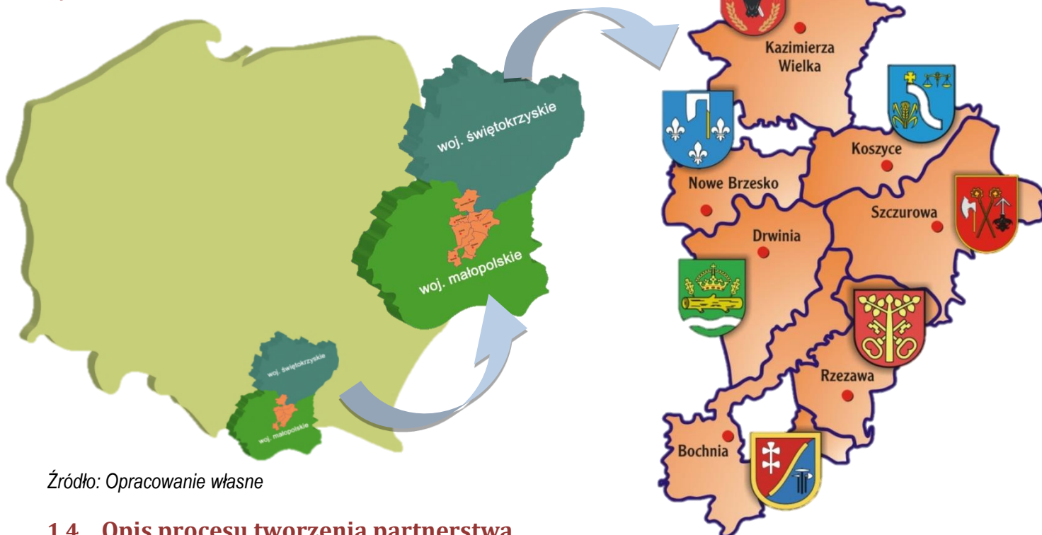
Rysunek 1 Mapa obszaru LGD