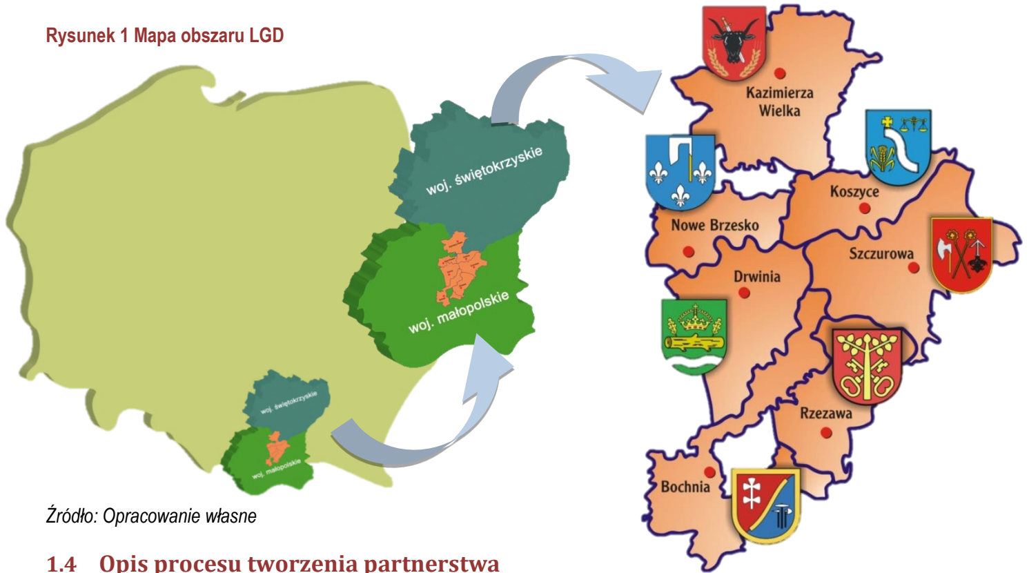
Rysunek 1 Mapa obszaru LGD