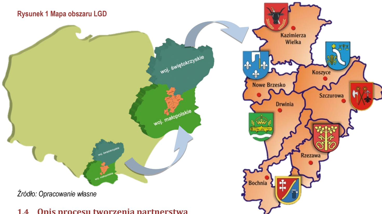
Rysunek 1 Mapa obszaru LGD